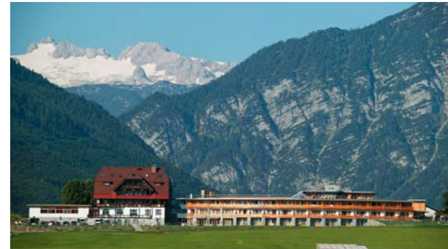
ALLES IN EINKLANG: Das traditionsreiche Gasthaus, der moderne Neubau und im Hintergrund das majestätische Dachsteinmassiv.

DAS LINDNER HOTEL & SPA – DIE WASNERIN IN BAD AUSSEE verbindet erfolgreich Tradition und Moderne . Schon im 15. Jahrhundert als Gasthaus bekannt, ist die Wasnerin heute ein modernes Wellnesshotel, umgeben von einer beeindruckenden Naturkulisse.