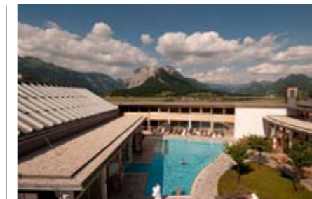
GANZJAHRESWELLNESS: Das beheizte Solebecken ist auch im Winter offen.

BAD AUSSEE IST NICHT NUR DER GEOGRAFISCHE MITTELPUNKT ÖSTERREICHS, sondern seit jeher Anziehungspunkt für Erholungssuchende. Bereits 1868 wurde Aussee zum Kurort erklärt, seit 1911 darf der Ort offiziell den Titel „Bad“ dem Namen voranstellen. Im 19. Jahrhundert waren es vor allem die blaublütigen Zeitgenossen, die dem Charme des steirischen Salzkammerguts verfielen. Allen voran Erzherzog Johann, dessen Geschichte im Ausseerland jedes Kind kennt. Der volksnahe Modernisierer, der die Steiermark in ein neues Zeitalter führte und für die Liebe zur bürgerlichen Postmeistertochter Anna Plochl auf den Thron verzichtete. Ihm kann man auch heute kaum entkommen. Erzherzog Johann lacht aus Schaufenstern, von Speise- und Ansichtskarten und von Hausfassaden. In Gasthäusern und Hotels sind Speisesäle, Stüberln und Zimmer nach dem Erzherzog benannt. Auch im Lindner Hotel & Spa – Die Wasnerin trägt eine Suite seinen Namen. Dabei muss sich die Wasnerin gar nicht im historischen Glanz verblichener Habsburgergrößen sonnen, sie kann auch eine eigene Geschichte vorweisen. Schon im 15. Jahrhundert stand hier ein Gasthaus, das seinen Namen auf die Torfstecherei rund um den See zurückführt. Ursprünglich eine Labestation für Pferde, Kutscher und Fahr-