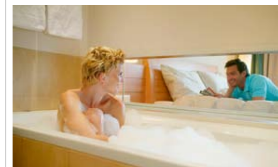
BADEWANNE MIT AUSBLICK: Die Zimmer überraschen mit netten Details.