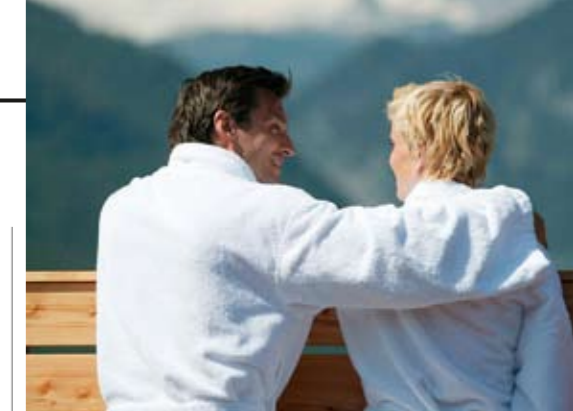
TRAUMHAFT SCHÖN: Wohin man blickt, nichts als Berge.

Im Neubau findet sich alles, was man von einem modernen Wellnesshotel erwartet. Eine großzügige Bade- und Saunawelt mit einem 80-Quadratmeter-Innenpool und einem beheizten 160 Quadratmeter großen Sole-Außenbecken, das auch im Winter geöffnet ist. Dazu kommen noch ein Dampf-